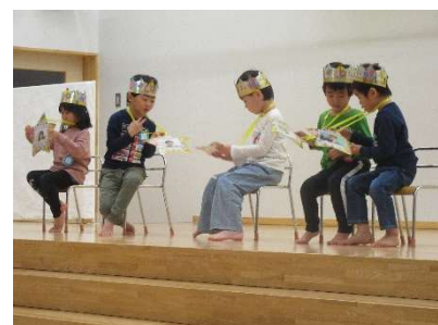
お誕生会で先生から贈り物をもって見やっこしました