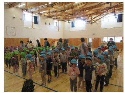
鯉のぼりの歌をみんなで歌いました