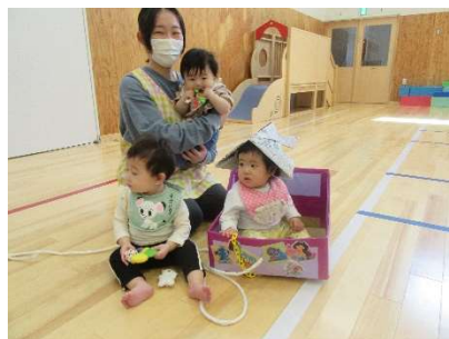
健やかな成長を願っています