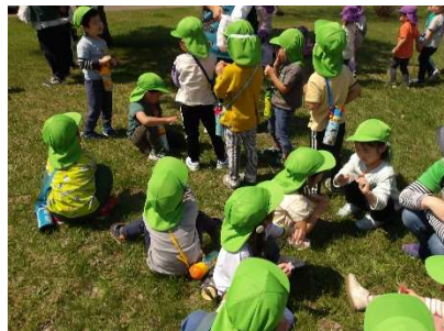
おやつを食べて鬼ごっこをしました