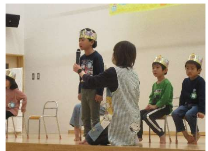
お誕生会で自己紹介をする年長さん