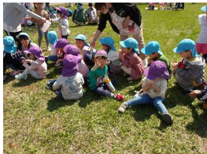
年少さんは年長さんと一緒に花見に行きました