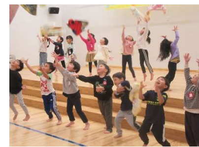
誕生会で出し物をするたいよう組