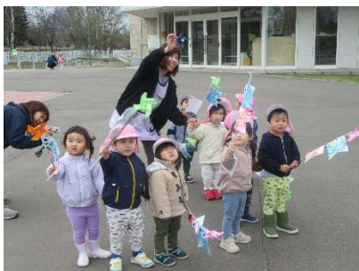
めっちゃ館の鯉のぼりを見に行きました

暖かい日が少しずつ増えてきたので、園庭の遊具や築山で遊んだり、お隣の運動公園周辺を散歩したり、公園の中にある遊具で楽しい時間を過ごしています。5月2日は9時から『こどもの日集会』を全園児で行いました。学年参観日に、来園くださりありがとうございました。各学年の子どもたちの笑顔がたくさん見られてとても楽しかったです。安心して時間を過ごしていましたね。