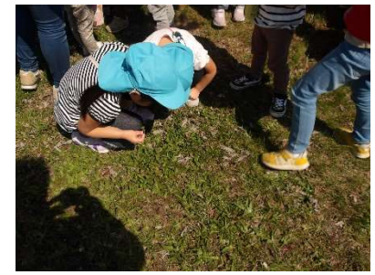
虫を見つけて大はしゃぎをしました