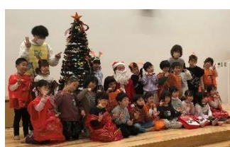
年長さんは仮装して参加です