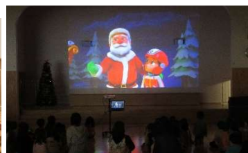
子どもたちに人気のアニメ パウパトロール

12月21日、楽しみにしていたクリスマス会が行われました。サンタさんから贈物をもらったり、パウパトの動画を観たり、クリスマスにちなんだクイズをして子どもたちは大はしゃぎでした。「いい子にしていたら来年も来るよ」