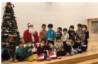
サンタさんと記念写真