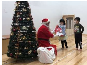
贈物をもらう年中さん