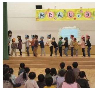
12月のお誕生会で劇遊びを披露する年少児