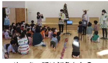
サンタの服は何色かな?