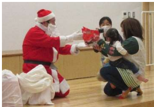
サンタさん、ありがとう。