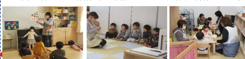
退園するつき組の園児Sさんにプレゼント／1歳児読み語り／0歳児10時食