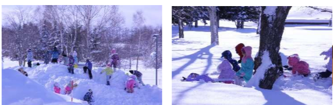
駐車場横の大きな雪山で大はしゃぎ／森林で動物探し！

吹雪模様が何とか終わり、久しぶりの青空が広がりました。銀世界が遊びの雪原になりました。