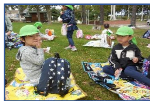
ソーシャルディスタンス