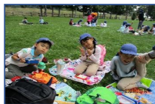
おいしい、パクパク