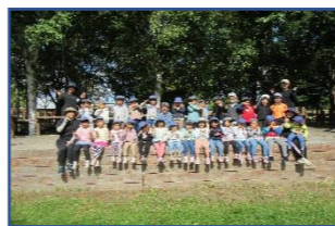
こども園最後の遠足

【おうちの人へお礼】 就労や家事などで大変お忙しいのに、遠足の際、お弁当づくりや身支度の用意など、お世話していただき、本当にありがとうございました。園児は友達と遊んだり、お弁当やおやつをおいしそうに食べたりしました。どの子も元気に園に戻りました。無事遠足を終えられたことが何より嬉しいです。