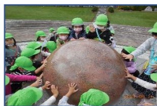
この丸い物、なあに？