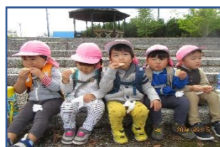
もぐもぐ美味しいね