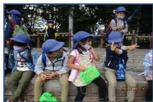
何して遊ぼうかなあ