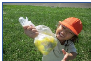
黄色い綿菓子いっぱい